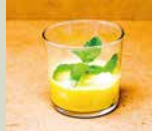
カボチャと ココナツの ぜんざい 400