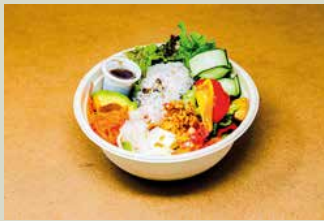
サラダボウル弁当 1,000

サラダ(生野菜)をベースに旬の素揚げした野菜、海老、アボカド、チキンなど色々な食感と味わいが楽しめます 満足度が高く、当店自慢の人気サラダです