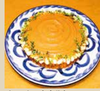
チョコレートタルト

5号 15cm 4-6人 3,000- 6号 18cm 6-8人 4,000- 7号 21cm 8-10人 5,000-