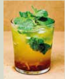
レモンミント ソーダ 450