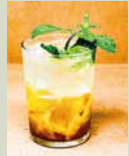
ホームメイド ジンジャーエール 450