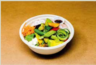
ハナファームキッチンサラダボウル 1,000

メイン料理(月替)を中心に、野菜やお肉などの惣菜をふんだんに盛合せました バランスも取れてボリュームたっぷりです 人気NO1のお弁当です ●大口注文の場合のみ、内容変更1000円(税込) ご注文頂けます