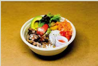
チキンオーバーライス 1,000

牛もも肉100%手切りステーキハンバーグです ジューシーなお肉と、濃厚なチェダーチーズ、オリジナルスパイスやソースなど様々な具材とフレイバーをお楽しみください * 限定1日10食(ご確認ください)