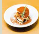
自家製濃厚 ティラミス 450

5号 15cm 4-6人 3,000~ 6号 18cm 6-8人 4,000~ 7号 21cm 8-10人 5,000~