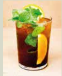
ホームメイド コーラ 500