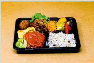
ハナファームキッチン mini 弁当 800

国産鶏胸肉をさっぱりとジューシーに低温調理しました ねぎたっぷりの油淋鶏ソースが食欲をそそります