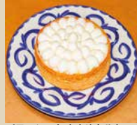
パティシエおすすめタルト

5号 15cm 4-6人 3,000- 6号 18cm 6-8人 4,000- 7号 21cm 8-10人 5,000-