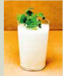
バナナバナ ラシェイク 500