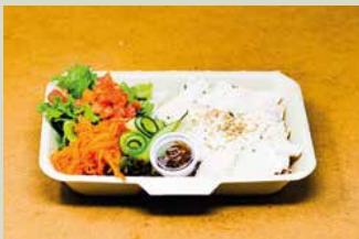
ハイナン鶏飯弁当 800

サーロインをしっかりと低温調理した後、香ばしく外側は焼き上げました 甘辛い韓国風カルビソースとお肉、ご飯の相性が抜群です