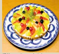
季節のフルーツタルト

5号 15cm 4-6人 3,000- 6号 18cm 6-8人 4,000- 7号 21cm 8-10人 5,000-