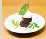
ショコラ テリーヌ 450