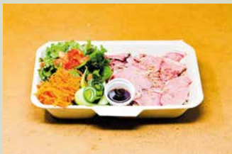
ローストビーフ弁当 950

ぷりぷりっの海老をガーリックスパイスでふわっ・かりっと仕上げました 醤油バターガーリックソースでコクのある濃厚な味わいです