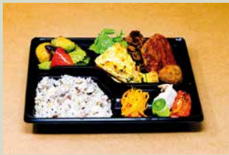
ハナファームキッチン弁当 1,100

メイン料理(月替)を中心に、野菜やお肉などの惣菜をふんだんに盛合せました バランスも取れてボリュームたっぷりです 人気NO1のお弁当です ●大口注文の場合のみ、内容変更1000円(税込) ご注文頂けます