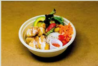
ガーリックシュリンプライス 1,000

国産鶏もも肉をオリジナルスパイスでマリネしてボリュームたっぷり・ジューシーに仕上げました ピリ辛なシラチャーソースとヨーグルトソースでクセになる味わいです