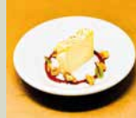
プレミアム チーズケーキ 450